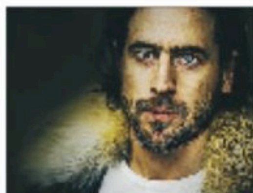
Ola Rapace behöver en trenchcoat.